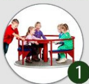
Karrusel med bænk

Grundejerforeningen Digehaven i Sengeløse