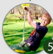
Svævebane op af bakken