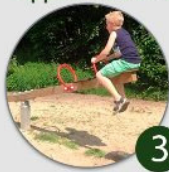
Vippe med 4 sæder